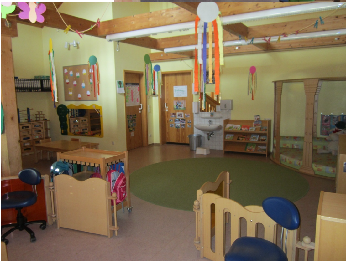
Gruppenraum und Kuschecke Honigbienenchen