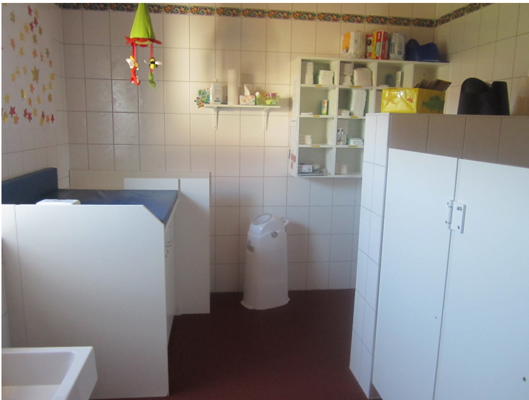
Wi- ckel- raum und