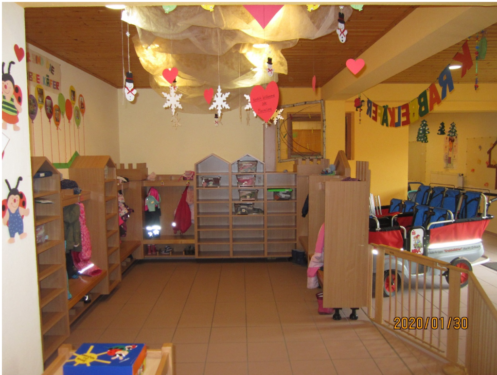
Gardero- be und Gruppen- raum Krabbel- käfer